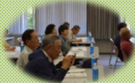
菊づくり体験講座 講師: J A 呉 江能営農経済センター白桃主任